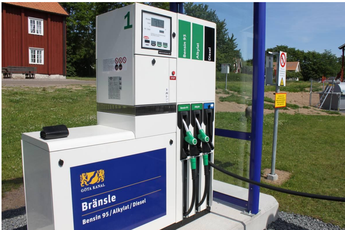
Sjömack i Motala där vi säljer miljöbränslet Alkylat.

Bolaget saknar dock verktyg att mäta andelen av utgifterna som betalas till lokala leverantörer den bedöms dock vara högre än 90 %.