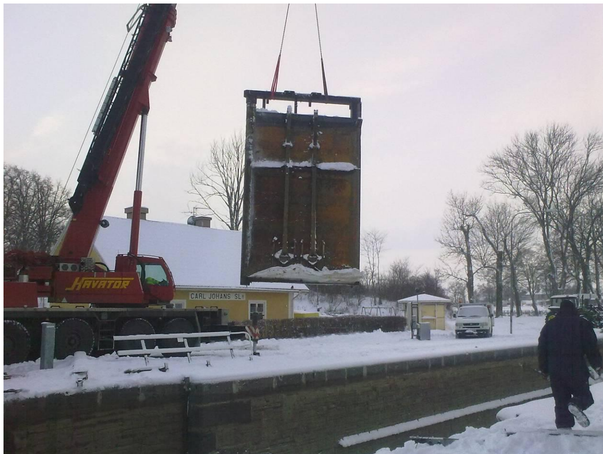
Portlyft Carl Johans slusstrappa, Bergs slussar

Årligen erhåller Göta kanalbolag ett upprustningsbidrag från ägaren som ska täcka behovet för årligt underhåll. 2010 var upprustningsbidraget 19,9 miljoner kronor. Arbetet utförs utifrån originalritningar och ursprungliga konstruktionslösningar och till största delen av egen personal och med eget materiel. Målet är att kanalen och fastigheter, efter några decennier av eftersatt underhåll i mitten av 1900-talet, ska återsättas i så nära ursprungligt skick som möjligt. Detta sker i nära samarbete med de antikvariska myndigheterna och Länsstyrelserna.