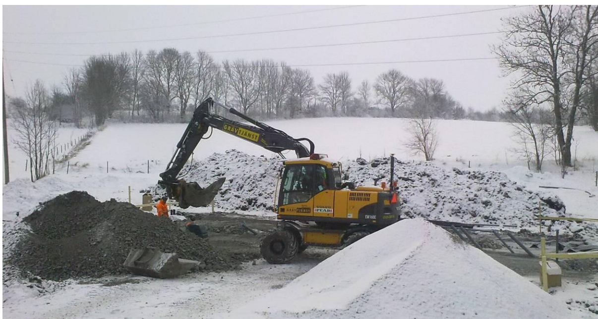
Nytt servicehus byggs vid Bergs slussar

Kanalbolaget avverkar ca 20 000 kubikmeter virke/år varav 12 000 genom föryngringsavverkning och 8 000 genom gallring. Detta motsvarar 95 % av tillväxten. Ungskogsröjning sker på ca 80 hektar/år. Efter 2007 års slutavverkningar har ca 17 000 plantor återplanterats.