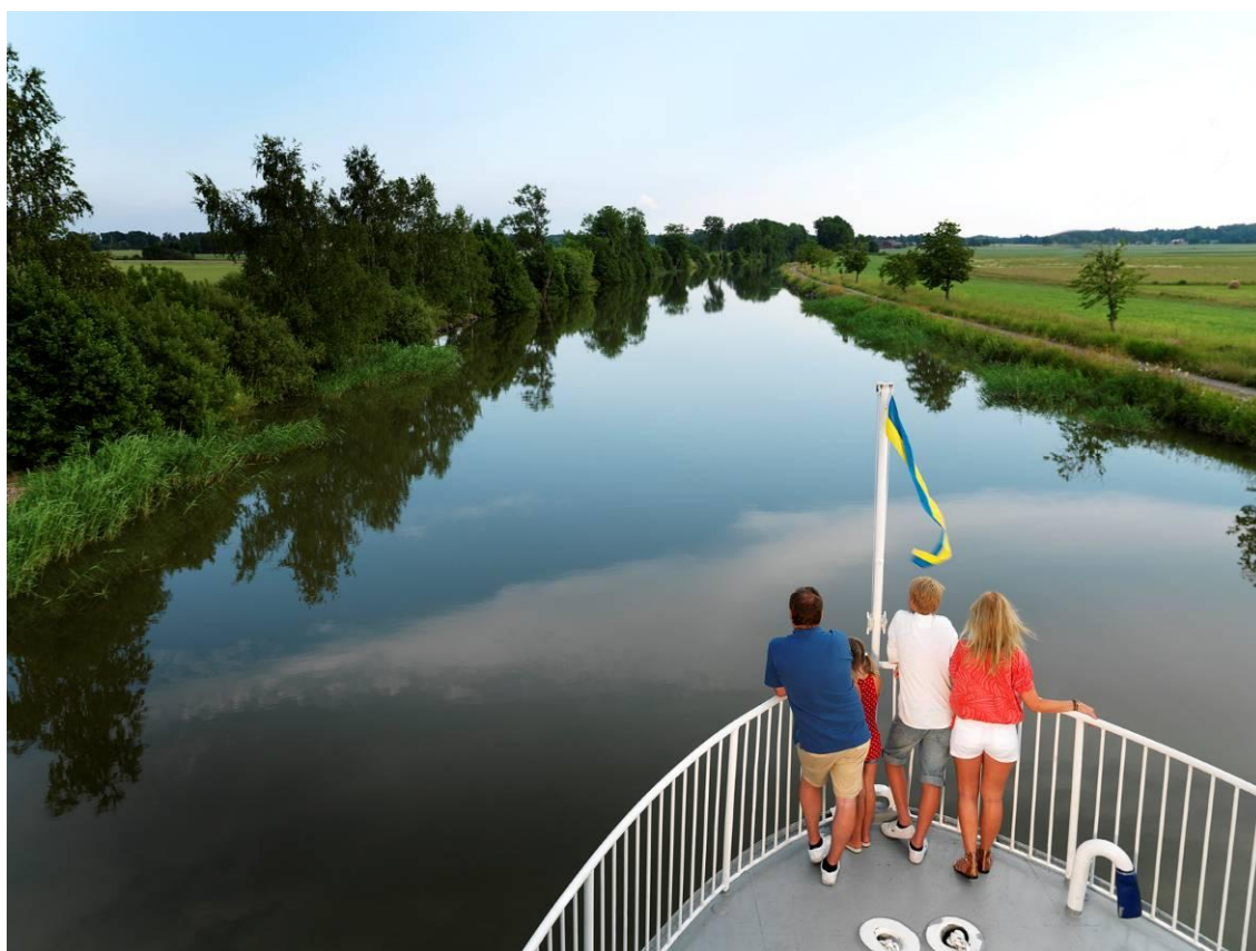
Kanalkryssning med M/S Ceres

Denna, bolagets tredje hållbarhetsredovisning, avser kalenderåret 2010.