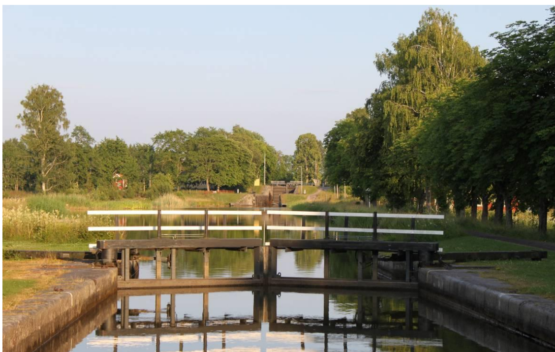
Hajstorps nedre sluss

**Invald i styrelsen vid årsstämma 2010-04-23