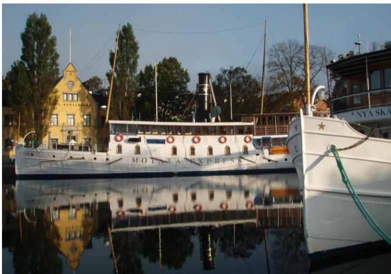
Huvudkontoret i Motala