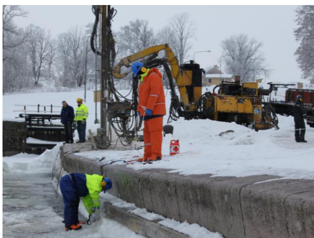
Renovering av kajen i Berg

Årligen erhåller Göta kanalbolag ett upprustningsbidrag från ägaren som ska täcka behovet för årligt underhåll. 2009 var upprustningsbidraget 19,9 miljoner kronor. Arbetet utförs enligt gamla ritningar och ursprungliga arbetsmetoder och till största delen av egen personal och eget materiel. Målet är att kanalen och fastigheter, efter några decennier av eftersatt underhåll i mitten av 1900-talet, ska återsättas i så nära ursprungligt skick som möjligt. Detta sker i nära samarbete med de antikvariska myndigheterna och Länsstyrelserna.