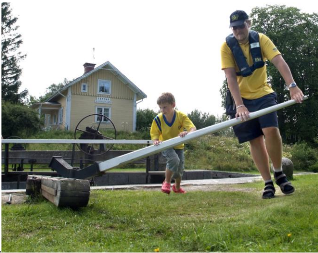
Slussning i Tåtorp

Kanalrörelsens stomme är de ersättningar fritidsbåtar och passagerarbåtar betalar för att erhålla sin "frisedel" det vill säga passage genom kanalen. De senaste årens kraftiga intäktsökningar beror till lika delar av att båtstorleken ökat och att prissättningen är progressiv samt att antalet båtar ökar. Troligen tillbringar våra båtgäster mer tid i kanalen då det blir mer och mer att uppleva. De utländska båtarna utgör cirka 30 % av alla båtar och har de senaste åren ökat med någon procent varje år. Passagerarbåtarna har under de senaste åren kört cirka 1.400 turer per säsong. Under kanalrörelsen redovisas också våra arbeten vid Kanalbolagets varv i Sjötorp, båtuppläggningar längs kanalen samt de entreprenadarbeten som Kanalbolaget utför åt Vägverket.