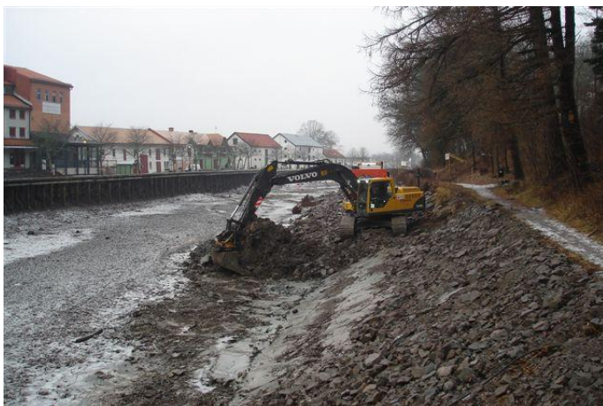
Strandskoning i Söderköping

Det innebär att alla renoveringar av kanalens anläggningar sker i nära samarbete med vårdande myndighet.