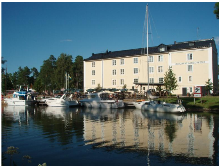
Norrqvarn Hotell och Vandrarhem

Vi ansluter fortlöpande våra byggnader till kommunalt avlopp, där våra egna avlopp är uttjänta. Under 2009 har 4 byggnader blivit omkopplade. Vi anlitar lokala leverantörer och använder oss av virke från vår egen skog vid underhållet av till exempel slussportar.